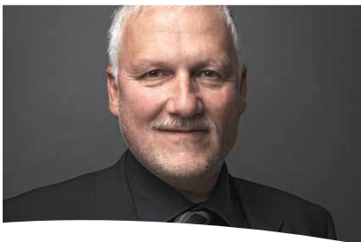
Peter Gomm, Präsident SODK (Sozialdirektoren-Konferenz) Regierungsrat Kanton Solothurn

«Fachleute aus der Sozialen Arbeit wirken an der Verbesserung der sozialen Sicherheit mit.»