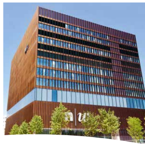
Site de Muttenz

Bachelor of Arts FHNW in Sozialer Arbeit Master of Arts FHNW in Sozialer Arbeit Coopération avec la Haute école évangélique de Freiburg im Breisgau et l'Université de Bâle